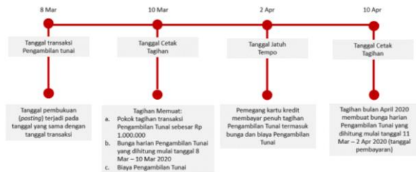
Ilustrasi Perhitungan Bunga Transaksi Tarik Tunai (Cash Advance)

Bunga untuk Pengambilan Tunai (Cash Advance) dibebankan dan dihitung sejak Tanggal Penarikan (Cash Advance) sampai dengan tanggal dilakukannya pembayaran penuh dari transaksi Pengambilan Tunai tersebut. Suku bunga yang berlaku untuk transaksi Pengambilan Tunai tercantum pada Lembar Penagihan. Biaya, denda, ataupun bunga yang belum dibayarkan tidak termasuk dalam komponen perhitungan bunga. Untuk perhitungan bunga secara lengkap dapat dilihat pada ilustrasi Perhitungan Bunga Kartu Kredit.