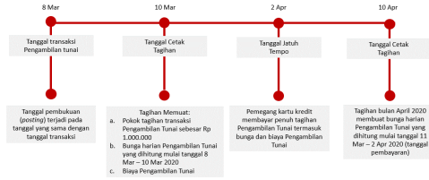
Ilustrasi Perhitungan Bunga Transaksi Tarik Tunai (Cash Advance)

Bunga untuk Pengambilan Tunai (Cash Advance) dibebankan dan dihitung sejak Tanggal Penarikan (Cash Advance) sampai dengan tanggal dilakukannya pembayaran penuh dari transaksi Pengambilan Tunai tersebut. Suku bunga yang berlaku untuk transaksi Pengambilan Tunai tercantum pada Lembar Penagihan. Biaya, denda, ataupun bunga yang belum dibayarkan tidak termasuk dalam komponen perhitungan bunga. Untuk perhitungan bunga secara lengkap dapat dilihat pada ilustrasi Perhitungan Bunga Kartu Kredit.