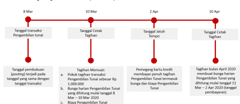
Ilustrasi Perhitungan Bunga Transaksi Tarik Tunai (Cash Advance)

Bunga untuk Pengambilan Tunai (Cash Advance) dibebankan dan dihitung sejak Tanggal Penarikan (Cash Advance) sampai dengan tanggal dilakukannya pembayaran penuh dari transaksi Pengambilan Tunai tersebut. Suku bunga yang berlaku untuk transaksi Pengambilan Tunai tercantum pada Lembar Penagihan. Biaya, denda, ataupun bunga yang belum dibayarkan tidak termasuk dalam komponen perhitungan bunga. Untuk perhitungan bunga secara lengkap dapat dilihat pada ilustrasi Perhitungan Bunga Kartu Kredit.