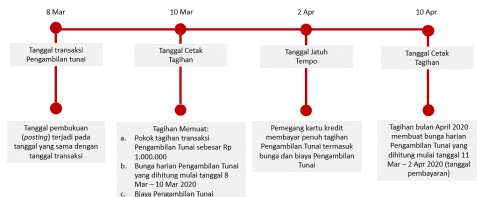
Ilustrasi Perhitungan Bunga Transaksi Tarik Tunai (Cash Advance)

Bunga untuk Pengambilan Tunai (Cash Advance) dibebankan dan dihitung sejak Tanggal Penarikan (Cash Advance) sampai dengan tanggal dilakukannya pembayaran penuh dari transaksi Pengambilan Tunai tersebut. Suku bunga yang berlaku untuk transaksi Pengambilan Tunai tercantum pada Lembar Penagihan. Biaya, denda, ataupun bunga yang belum dibayarkan tidak termasuk dalam komponen perhitungan bunga. Untuk perhitungan bunga secara lengkap dapat dilihat pada ilustrasi Perhitungan Bunga Kartu Kredit.