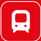
Metro & Trem

Buat keliling-keliling, ini pilihan transport anti repot: