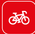
Sewa Sepeda/ Skuter

Biar dianggap warlok mentok, ini pojok-pojok tempat warlok China pada kongkow: